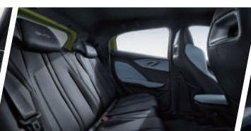
Espacio Interior Optimizado