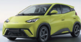
400KM NEDC de Autonomía