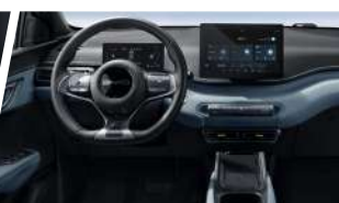
Sistema de Cabina Inteligente BYD