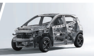
Estructura Corporal de Alta Resistencia