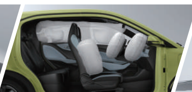
Equipado con 6 Bolsas de Aire