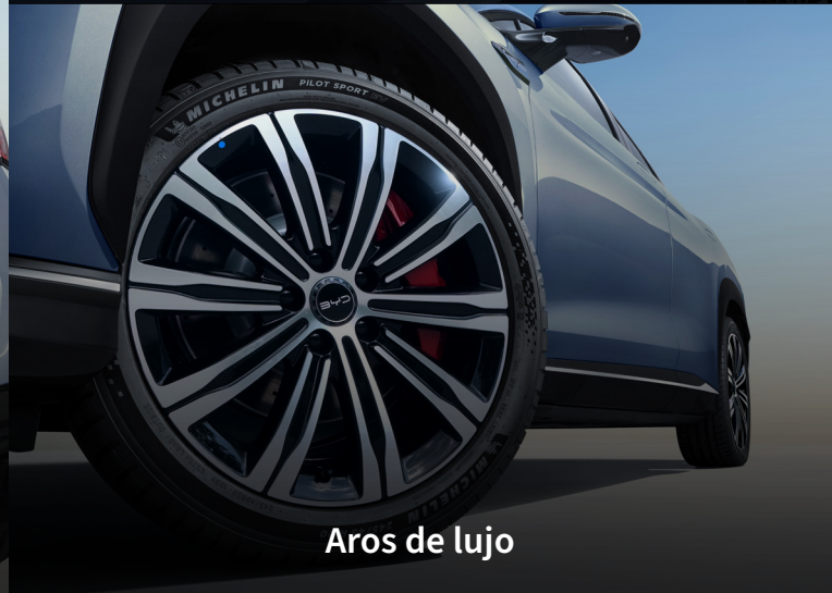
Aros de lujo