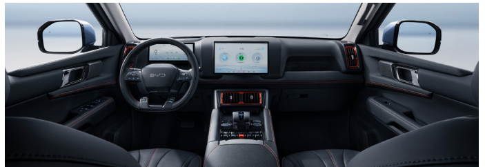
Negro con naranja